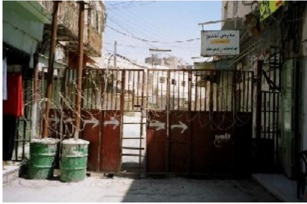
מחסום בעיר העתיקה בחברון.

הריסת בתים הפרה נפוצה אחרת של כללי המשפט הבין-לאומי ההומניטרי שצה"ל נוקט, היא מדיניות הריסת הבתים בתואנות שונות: