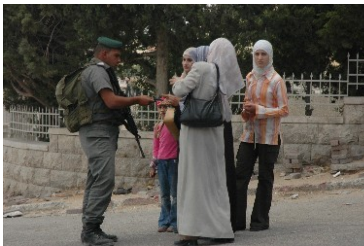
הגבלות חופש התנועה במזרח ירושלים.

חופש התנועה חופש התנועה מופר באמצעים שונים: כאשר אזרחים נתונים לעוצר מתמשך, כאשר אזרחים נאלצים לעבור במחסומים רבים, בהם פעמים רבות הם מעוכבים ללא צורך, וכן מוטלים איסורים על השימוש בכבישים או בכלי תחבורה. הפרה זו של חופש התנועה גוררת פגיעה בזכותם של הפלסטינים להתפרנס, לעבד את אדמותיהם, לקבל שירותי רפואה ובזכותם לחינוך.