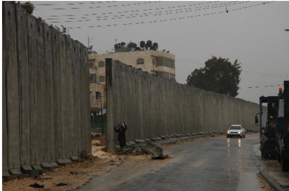
גדר ההפרדה בא-ראם לפני האטימה הסופית.

אך עליה לבחון את תוואי הגדר באופן שיאזן בין צרכי הביטחון לזכויות האדם של התושבים הפלסטינים. לגבי קטע הגדר הספציפי באלפי מנשה, אשר גרם לכליאתם של תושבי חמישה כפרים פלסטיניים בתוך מובלעת, הכפופים למשטר היתרים ולפגיעה חמורה בחופש התנועה ובנגישות לפרנסה, בריאות, חינוך ותשתיות, בג"צ קבע שהתוואי איננו מידתי ויש לפרקו ולהזיזו.