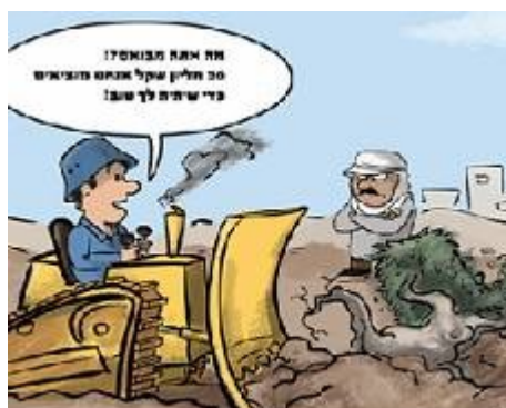
מתוך הקומיקס (מוקטן). איור: אלון סימון

בפסק הדין קבע בג"ץ כי הצבא חרג מסמכותו בסגירת הכביש לפלסטינים, וכי לא ניתן למנוע באופן גורף מהפלסטינים גישה לכביש . עם זאת, לצד ההצהרות בדבר החובה לכבד את המשפט הבינלאומי וחשיבות השמירה על זכויות האדם של הפלסטינים, השאיר בית המשפט לצבא שיקול דעת נרחב לגבי אופן יישום ההחלטה.