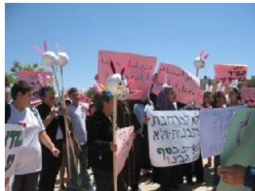
מפגינים נגד תוכנית ויסקונסין.

באפריל 2010 הגישה האגודה עתירה לבג"ץ , יחד עם עוד ארבעה ארגוני זכויות אדם וצדק חברתי, בדרישה לבטל את תכנית ויסקונסין, או לחלופין את מסירת הסמכויות השלטוניות שנעשתה במסגרתה לחברות למטרות רווח. העתירה היתה צעד נוסף במאבק מתמשך בתוכנית ויסקונסין על גלגוליה השונים, מאבק שקיימנו יחד עם הארגונים העותרים – סאוט אלעאמל, סינגור קהילתי, הקשת הדמוקרטית המזרחית ושומרי משפט – רבנים למען זכויות האדם, ועם עמותת מחויבות לשלום ולצדק חברתי, שלימים השתלבה באגודה לזכויות האזרח. (ראו למשל פניה לחייכים מדצמבר 2009, ואת נייר העמדה " לא אדוני השר " שהפיקו הארגונים ומפרט את כשלי התוכנית).