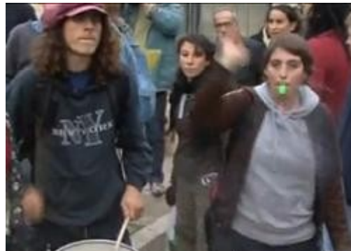
מפגינים בשייח ג'ראח.