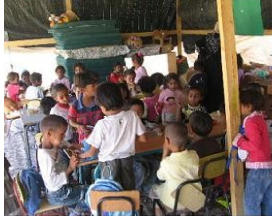
רכמה: גן ילדים מאולתר, שנהרס.

במאי 2010 ניתן פסק הדין: בית המשפט פסק כי משרד החינוך ומועצת ירוחם מפירים את חוק לימוד חובה, היות שהפיתרון שהם מציעים לילדים בגיל הרך אינו מספק. לפיכך קבע, כי משרד החינוך ומועצת ירוחם חייבים לדאוג להקמת גני ילדים לכל הילדים הבדואים בגילאי 3-4 המתגוררים בתחום השיפוט של ירוחם.