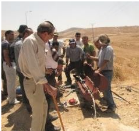
החיבור של המים לא-תוואנה, 26.7.10

האגודה וארגון "במקום" ניהלו קמפיין אינטרנטי בשם " פעולה אחת ביום ", שמטרתו לייצר פעולה אפקטיבית של גולשים המביאה להעלאת מודעות ואף לשינוי בשטח . הקמפיין עסק בהפרות הזכות למים וזכויות תכנון ובניה בשטחי C בגדה המערבית, הנמצאים באחריות ישראל, והתמקד בשינוי המציאות בכפר א-תוואנה במטרה לחברו לרשת המים ולאפשר בניית בתים.