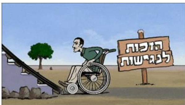
מתוך סרטון אנימציה של האגודה. יוצר: יוני גודמן

כמדי שנה הפיקה האגודה כרזה מיוחדת לציון יום זכויות האדם הבין-לאומי , בעברית ובערבית, המיועדת למוסדות חינוך. גם הכרזה עמדה בסימן 60 שנה להכרזה, והיא כללה 15 קריקטורות המתארות סיטואציות שונות מהארץ ומהעולם ומעוררות דיון בשאלות של זכויות אדם. לכרזה צורף מדריך למורה , גם הוא בשתי השפות, המציע דרכים שונות לעבודה חינוכית באמצעות הכרזה. הכרזה והמדריך הופצו בכ-10,000 עותקים לבתי ספר, תנועות נוער ומתנ"סים, בשיתוף פעולה עם משרד החינוך, שעודד את המורים להשתמש בחומרים. הכרזה והמדריך זכו לתגובות נלהבות מאנשי חינוך.