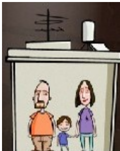
מתוך סרטון האגודה בנושא הזכות לדיור. יוצר: יוני גודמן

בחודש יולי 2008 פרסמה האגודה את הדוח "הנדל"ניסטית – הפרת הזכות לדיור על-ידי מדינת ישראל" . בדוח, הראשון מסוגו, בוחנת האגודה את מדיניות הממשלה בתחום הדיור לאור אחריותה של המדינה לממש את הזכות לקורת גג של אזרחיה ושל תושביה. בדוח עמדנו על המגמה ההולכת וגוברת של התנערות המדינה מאחריות על הזכות לקורת גג של תושביה, המקבלת את עיקר ביטוייה בהפרטת האחריות, בקיצוץ משמעותי בתקציבי הסיוע ובהיעדר הגנות לדיירים וללווים, והצבענו על ההשלכות הקשות של התנערות המדינה מאחריות והעברת מרכז הכובד לשוק הפרטי. ועדת הכלכלה של הכנסת קיימה דיון מיוחד בדוח, ונציגי האגודה הוזמנו להציג את ממצאיו בפני הנהלה הבכירה של משרד השיכון. הדוח גם זכה לחשיפה תקשורתית נאה. במקביל לפרסום הדוח הפיקה האגודה סרטון אנימציה , שיצר האנימטור יוני גודמן, וממחיש את הפגיעה בזכות לדיור. הסרטון פורסם באתר ynet והופץ באמצעות המייל, בידיעון האגודה ובפורומים רלבנטיים באינטרנט.