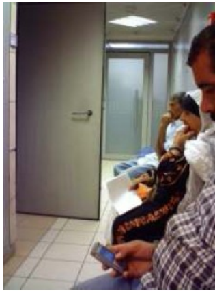
המסדרון הצר בלשכה בבאר-שבע, ובמרכזו הדלת לחדר האטום - מחלקת איחוד משפחות

האגודה לזכויות האזרח עתרה לבג"ץ בדרישה לחדול מאפלייתם לרעה של מבקשי מעמד ערבים בלשכה בבאר-שבע. בתגובה לעתירה הודיע משרד הפנים, כי ההפרדה בין מבקשי המעמד בוטלה : אוחד הטיפול במבקשי מעמד ערבים עם מבקשי מעמד שאינם ערבים; אין חדר קבלה מיוחד לערבים; ומבקשי מעמד ערבים מכל רחבי הדרום יכולים להגיש בקשות בכל לשכה בדרום, ולא רק בבאר-שבע. האגודה עוקבת אחר היישום, שבשלב זה מלווה בקשיים, והעתירה עודה תלויה ועומדת.