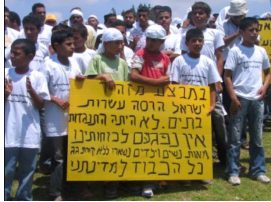
ילדים בדואים בהפגנה מול הכנסת, יולי 2007.

בחודש מרס 2009 הגישה האגודה לזכויות האזרח עתירה לבית המשפט לעניינים מינהליים בבאר שבע , בדרישה להקים גן ילדים עבור ילדי רכמה. העתירה הוגשה בשם יו"ר ועד הכפר, עמותת מחויבות לשלום ולצדק חברתי והאגודה לזכויות האזרח. כמו כן שותפים לעתירה תושבים מירוחם, הפעילים במסגרת קבוצת "מרקם אזורי" - קבוצה הפועלת בשיתוף פעולה עם הקהילה הבדואית השכנה למען הכרה ושיפור תנאי המחיה של רכמה. הקבוצה, שהוקמה והופעלה על ידי עמותת מחויבות לשלום ולצדק חברתי, פועלת החל מחודש מרס 2009 במסגרת מחלקת החינוך באגודה לזכויות האזרח. בעקבות העתירה מתקיים משא ומתן בין הרשויות לעותרים במטרה להקים את הגן במהירות.