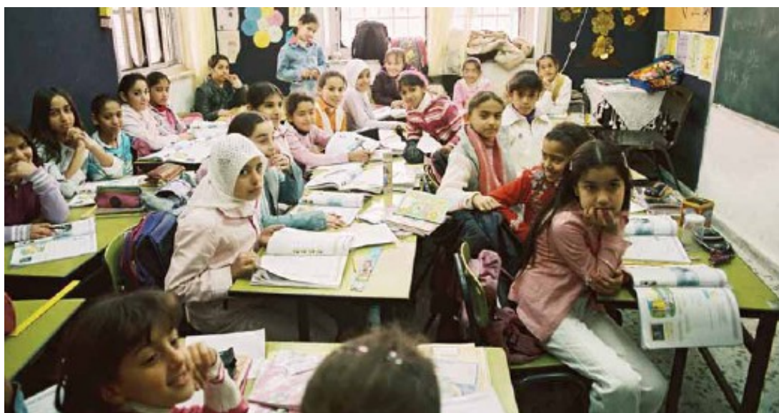
כיתה בירושלים המזרחית.

הם מונים שליש מתושבי ירושלים; מחציתם קטינים, ושני שליש מהם חיים מתחת לקו העוני; מאז 1967, למעלה משליש מאדמותיהם הופקע; למחצית מהילדים בגיל בית הספר אין מקום במערכת החינוך הממלכתית; הם סובלים מטרטורים אינסופיים במשרד הפנים; כמחציתם גרים בבתים שנבנו ללא היתר בלית ברירה, כיוון שלא הוכנו תוכניות מתאר לשכונותיהם; כמעט ואין להם שירותי דואר; מאות אלפים חיים בלי מערכת ביוב תקינה ובלא אספקת מים סדירה; מטפלים בהם מעט מדי עובדים סוציאליים, ויותר מדי שוטרים של משמר הגבול. זוהי ירושלים המזרחית. כך חיים שליש מתושבי עיר הבירה ש"חברה לה יחדיו".