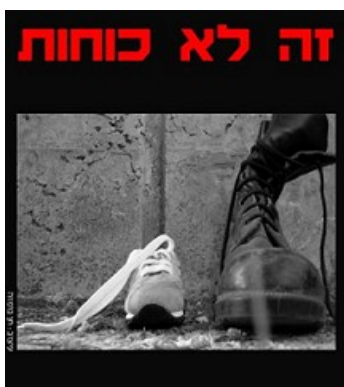
כרזה בנושא המשפט ההומניטרי הבין-לאומי. עיצוב: חן בומזה

האגודה לזכויות האזרח הציבה לעצמה כמטרה להעלות למודעות הציבורית את המשמעויות הקשות של פגיעה באוכלוסייה אזרחית במהלך סכסוכים מזוינים, ואת החובות המוטלות על הצבא למניעת פגיעות כאלה. במסגרת פרויקט המשפט ההומניטרי הבינלאומי מציעה האגודה לזכויות האזרח לקהלי יעד מגוונים פעילויות חינוכיות , שמטרתן להעמיק את הידע בנושא ולהעניק הזדמנות לביור עמדות ולדין. בין המשתתפים בפעילויות: פעילים חברתיים, סטודנטים, אנשי חינוך, מדריכים בתנועות נוער, אנשי תקשורת, חניכי שנת שירות וחניכים במכינות קדם-צבאיות. הציבור הרחב מוזמן להשתתף במגוון אירועים ברחבי הארץ – ימי עיון, כנסים, הרצאות, סרטים ופעילות אמנותית – המתנהלים בעברית ובערבית. מספר דוגמאות מני רבות: קיימנו השנה במכינה הקדם צבאית מעגן מיכאל קורס בהיקף של 9 מפגשים, שכלל גם סיור בירושלים המזרחית, וסדרת פעילויות – הרצאות, סדנאות וסיוורים – בשיתוף עם "ממזרח שמש", המרכז למנהיגות יהודית-חברתית. כמו כן קיימנו השנה כ-10 סדנאות מיוחדות הנוגעות ללחימה בעזה, שבהן נכחו כ-300 משתתפים, וסדרת מפגשי דיון פתוחים לקהל, בשיתוף מרכז שוויץ לחקר סכסוכים, תחת הכותרת "ידיעה, שתיקה ומעשה בסכסוכים בחברה הישראלית". לאחר כל פעילות, וביתר שאת במהלך המלחמה בעזה, הגיעו לאגודה בקשות רבות לפעילות ושאלות בנוגע לאסור ולמותר בעתות מלחמה, המוכיחות כי חלקים גדלים בציבור הישראלי רואה את האגודה כמקור ידע והדרכה בתחום.