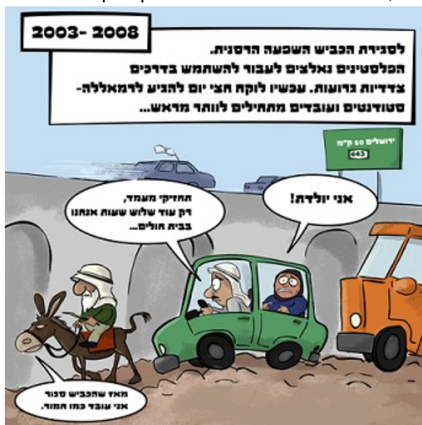
מתוך קמפיין (בהכנה) של האגודה נגד סגירת כביש 443 לתנועת פלסטינים. עיצוב: אלון סימון

פנינו בשמם של הכפרים בית פוריק ובית דג'ן בדרישה להסרת מגבלות התנועה הקיצוניות שהוטלו עליהם, ואשר הפכו את 18,000 תושבי הכפרים לכלואים תחת כיתור קבוע ומתמשך. מאז הכניסה והיציאה לכפרים התאפשרה אך ורק דרך מחסום אחד – מחסום בית פוריק. מסוף שנת 2005 מנעו כוחות צה"ל במחסום את כניסתו לכפרים של כל פלסטיני, שאינו רשום כתושב הכפרים. בכך הפך צה"ל את