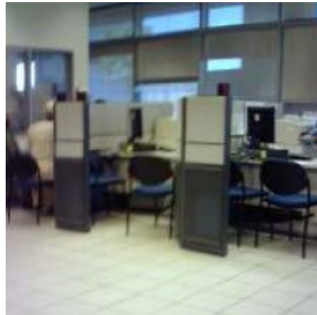
אולם מחלקת האשרות בלשכה בבאר-שבע, שבו יתנים שירותים למבקשי מעמד שאינם ערבים