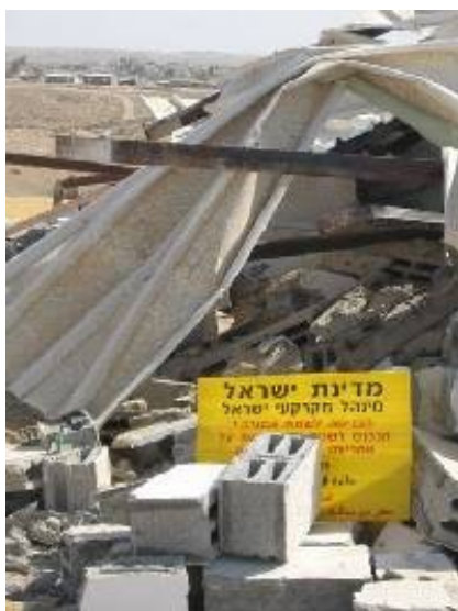
הריסת בתים בכפר הבלתי-מוכר א-סרה, נובמבר 2007.

• לרגל יום האישה הפיקה האגודה מוסף מיוחד בשפה הערבית , בשיתוף ארגון אעלאם – מרכז תקשורת לחברה הפלסטינית בישראל ועמותת א-סיוואר – העמותה הערבית לתמיכה בקורבנות אלימות מינית. מטרת הפרויקט הייתה להעלות נושאים הקשורים בזכויות נשים בעיתונות הערבית ולתת במה לנשים לבטא את עמדותיהן ביחס לנושאים חברתיים ופוליטיים. עשרת אלפים עותקים של המוסף הופצו בעיתונים המקומיים בשפה הערבית, וכ-3,000 עותקים הופצו למרצים ולסטודנטים ערבים באוניברסיטאות ולארגונים. המוסף פורסם גם באתר arabs48 .