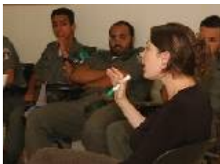
סדנא במשמר הגבול.

בשירות בתי הסוהר: קיימנו סדנאות רבות במהלך השתלמויות שעוברים הסוהרים (הקרויות "פעילות"). הסדנאות עסקו במגוון רחב של נושאים הנוגעים ישירות לעבודתם של הסוהרים, כגון זכויות אסירים וזכויות ילדים. השתלמות לסגל הבכיר בכלא אשל, שהסתיימה בשלהי שנת 2007, התקבלה בשביעות רצון רבה. האגודה החלה להפעיל השתלמות חדשה לצוותים של כל בתי הכלא (תשעה במספר) שבהם מוחזקים אסירים ביטחוניים. ההשתלמות מתייחסת לסוגיות ולדילמות המיוחדות שעמן מתמודדים הסוהרים ושאר אנשי הצוות, ושנובעות מאופיה המיוחד של אוכלוסיית האסירים.