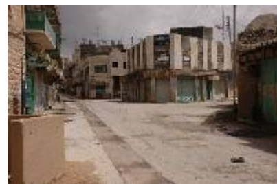
חברון בתמונות: עיר רפאים (מצגת) לצפייה לחצו כאן .

כתוצאה מהקמתן של נקודות ההתנחלות במרכז חברון ומפעולות הצבא הנעשות בשם ההגנה עליהן, התושבים הפלסטינים במרכז העיר חברון סובלים זה שנים ארוכות מהפרות בוטות של זכויות האדם הבסיסיות ביותר שלהם. האגודה, בצלם וארגונים עמיתים פועלים כבר שנים מול הדרגים הבכירים ביותר בממשלה ובצה"ל לשינוי המצב, ללא הועיל. בחודש אפריל 2008 הפיקו האגודה ובצלם, בשיתוף עם ארגון בני אברהם, קמפיין ציבורי , המשך לקמפיין שהופק שנה קודם לכן, שביקש להעלות למודעות הציבורית את התמשכות הפגיעות הקשות בתושבים הפלסטינים בחברון, ואת העובדה שדבר לא השתנה. הקמפיין הוצג באתרי האינטרנט ynet ו-ואללה (את חומרי הקמפיין אפשר למצוא בדף הקמפיינים באתר ). במקביל נמשכה הפעילות מול מקבלי ההחלטות הרלבנטיים, באמצעות תכתובות ופגישות עם בעלי תפקידים.