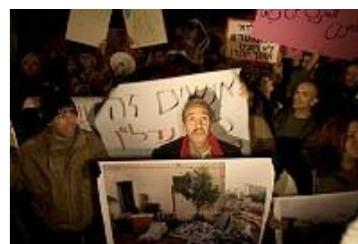
הזכות לדיור בתמונות: לצפייה לחצו כאן

בימי החורף עסקנו בבעיית היעדרם של מקלטים לחסרי בית, בעקבות מספר מקרים של אנשים חסרי בית שקפאו למוות ברחוב. הפעילות כללה ראיונות בתקשורת והשתתפות בישיבה בוועדה לביקורת המדינה בכנסת. בחודש מאי 2008 הגישה האגודה עתירה לבית המשפט לעניינים מינהליים בירושלים בשם אסיר חסר בית שעמד להשתחרר מהכלא, בדרישה לסייע לו למצות את ההליכים מול משרד השיכון מבעוד מועד, בטרם ישוחרר לרחוב. בעקבות העתירה הודיעה המדינה כי העותר יהיה זכאי לסיוע. העניין העקרוני עדיין תלוי ועומד בפני בית המשפט.