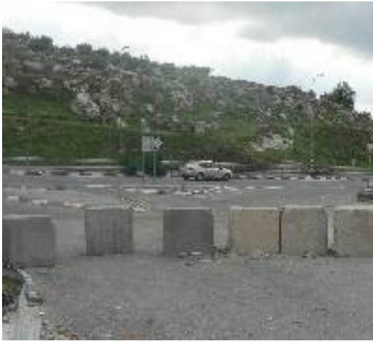
חסימת הכניסה/היציאה בין הכפר בית עור אלאתחא לבין כביש 443.

• המשכנו לטפל בעתירות התלויות ועומדות נגד המגמה ההולכת וגוברת של ההפרדה בתנועה בגדה המערבית , באמצעות הגבלות המוטלות על תנועתם של הפלסטינים במקומות שונים, המיוחדים לשימושם של ישראלים בלבד (למשל – כביש 443, צומת בית-עווא וכביש בית עווא-דורא). לצערנו, בחודש מרץ 2008, לאחר דיון בעתירה בעניין כביש 443, קיבל בית המשפט החלטה המסמנת מתן הכשר לכבישים נפרדים לפלסטינים ולישראלים בתוך השטח