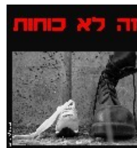
מתוך כרזה בנושא המשפט ההומניטרי הבין-לאומי. עיצוב: חן בומזה

במסגרת פרויקט המשפט ההומניטרי הבין-לאומי, המשכנו גם בשנה החולפת לקיים הרצאות וסדנאות חינוכיות לפעילים חברתיים, לסטודנטים, לאנשי חינוך, למדריכים בתנועות נוער, לחניכי שנת שירות ולחניכים במכינות קדם-צבאיות, במטרה להעמיק את הידע בנושא ולהעניק למשתתפים הזדמנות לבירור עמדות ולדיון. קיימנו לראשונה תוכנית הכשרה מקיפה וייחודית לפעילים בארגוני החברה האזרחית, שמטרתה להטמיע את השיח של המשפט ההומניטרי בארגונים השונים, ובהתאמה, בחברה הישראלית בכללותה. בתוכנית השתתפו 21 פעילים ופעילות, שרכשו בה ידע תיאורטי בנושא המשפט